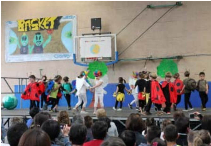
La classe de moyenne section en pleine représentation